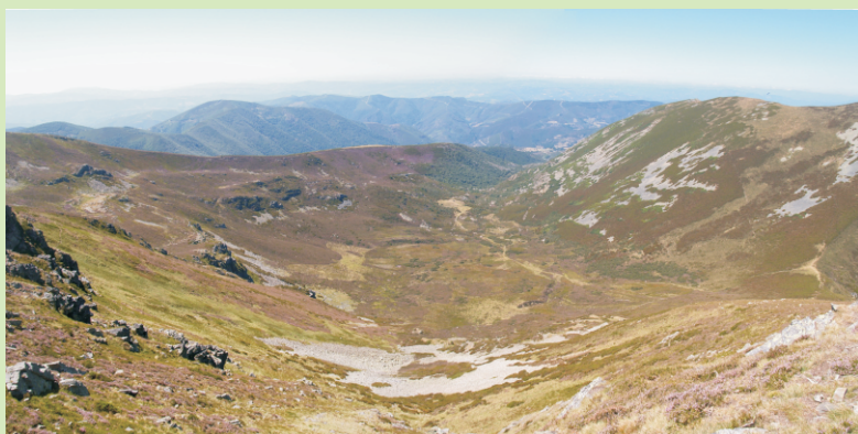
Vista desde o Mostallar sobre o Val de Piornedo.

A ruta parte da igrexa de Piornedo, no fondo da vila. Séguese o camiño que ascende sen coller ningún desvío e levando sempre á esquerda a Penalonga, crúzase o río e chégase á zona chan da Campa Redonda. Continúase subindo ata as ruínas das cabanas dos Extremeños e logo polo sendeiro que se desvía á esquerda pola Golada do Porto (entre a Penalonga e o Mostallar) e ao chegar ao tendido de arames ascéndese ata o cume por unha encosta moi forte.