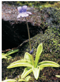
Pinguicula, unha planta das brañas que captura pequenos insectos.