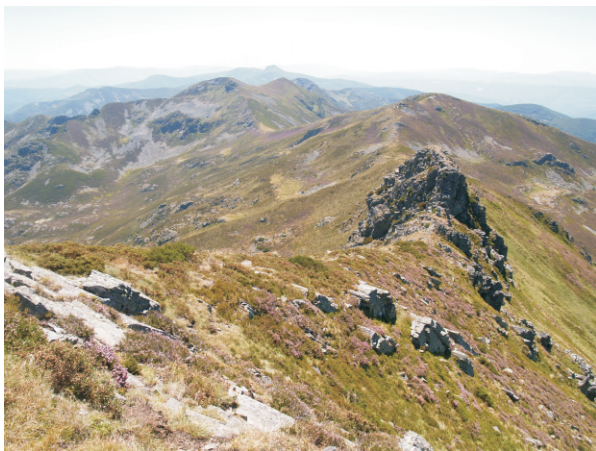
A liña de cumes do Ancares entre Galicia e León (de Mostallar a Tres Bispos)

Unha camiñada de montaña que nos vai permitir gozar dunha espléndida paisaxe e de fermosas panorámicas dos cumes dos Ancares galegos e leoneses, así como dunha rica flora e fauna das brañas, de prados de montaña e de matogueira. A mellor época é a finais de primavera e comezos de verán.