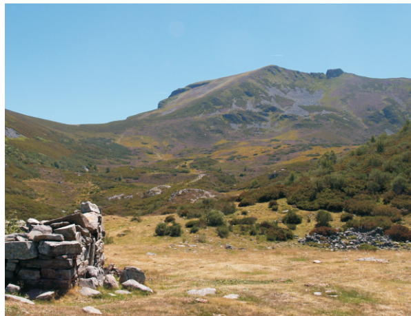
O Mostallar desde a cabana dos Extremeños