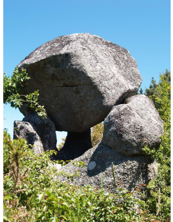
Pena dos Tres Pés

Nas abas da cara norte, as que caen ao río Castro, con poucos camiños de acceso e fortes pendentes, consérvanse masas de fraga autóctona entre as que hai numerosas plantacións de eucaliptos.