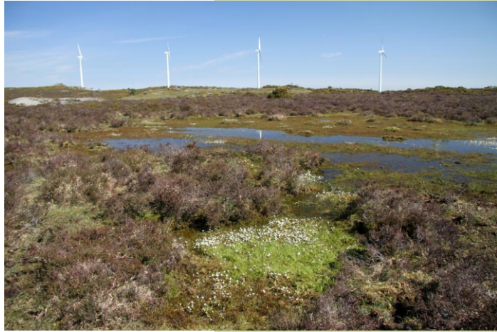
Cumes do Forgozelo (vista surlleste)