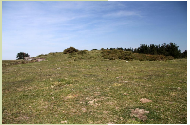
Mámona ao pé do curro de Covelo