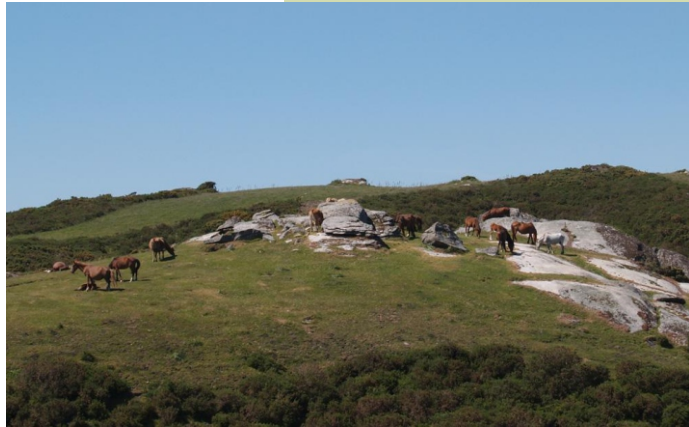
Cabalos e vacas