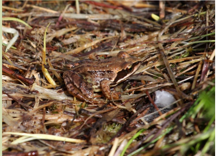
Ra vermella ( Rana temporaria )