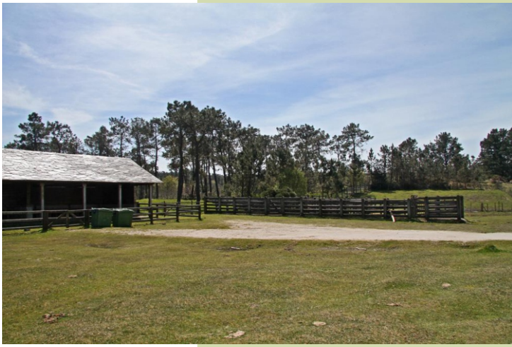
Curro de Covelo