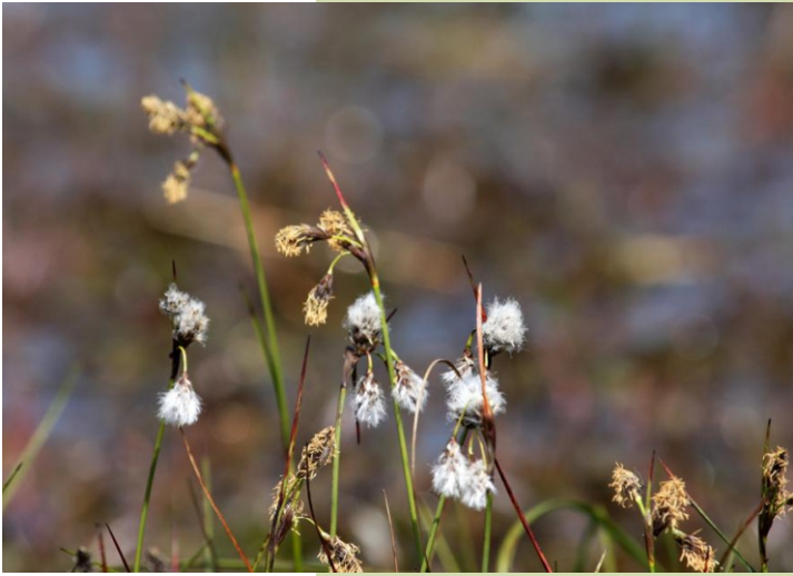
Xunco de algodón ( Eriophorum angustifolium )