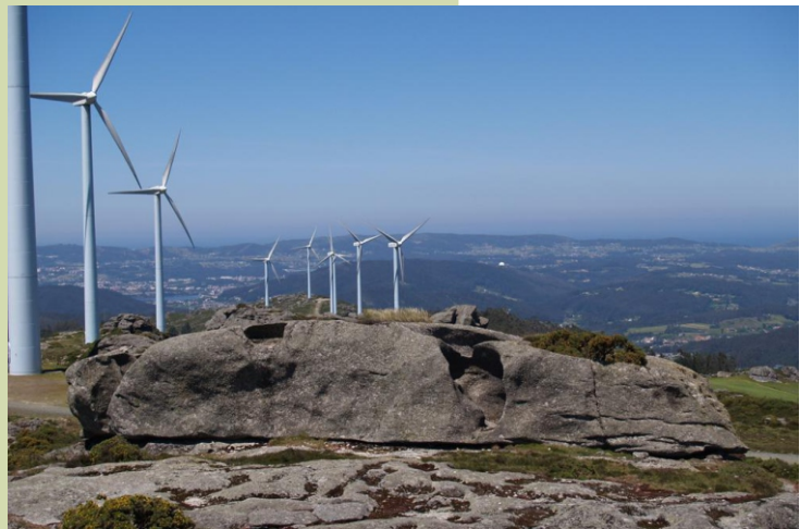
Cume do Racamonde