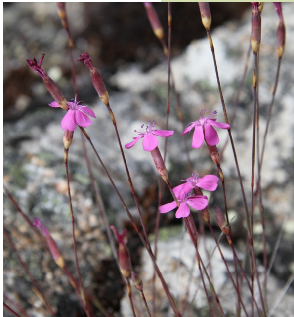
Caraveis do monte ( Dianthus loricifolius ).