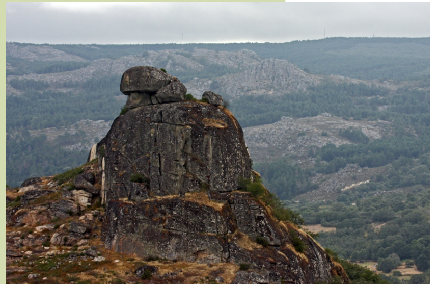
Pena da Raiña Loba. Conta a lenda que a Raiña Loba, metade muller metade loba, tiña atemorizada a xente dos arredores á que obrigaba a levarlle de comer tódolos días. Ata que un día os veciños de Pexeiros a enganaron decíndolle que lle trouxeran moita comida, a raiña asomouse para vela e nun descoido que tivo aproveitaron para matala empurrándoa en baixo do penedo.