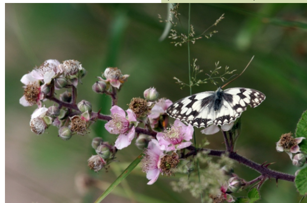
Bolboreta Melanargia lachesis sobre flores de silveira.