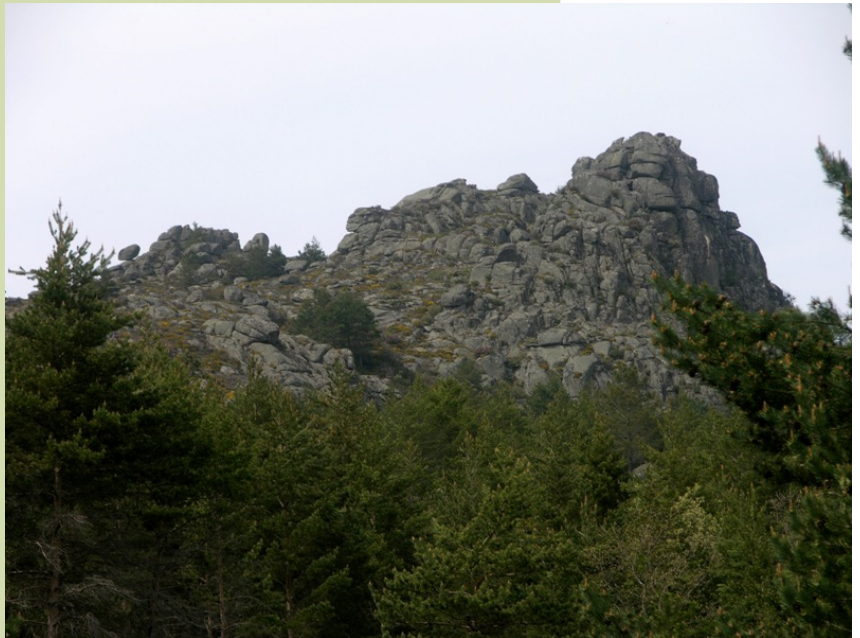
Cume do Cebreiro (1.267 m).