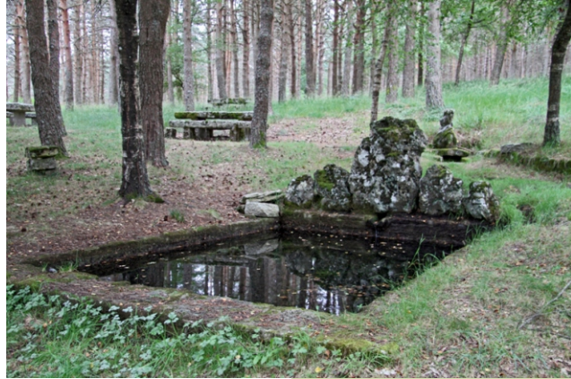
Fonte da Cunca