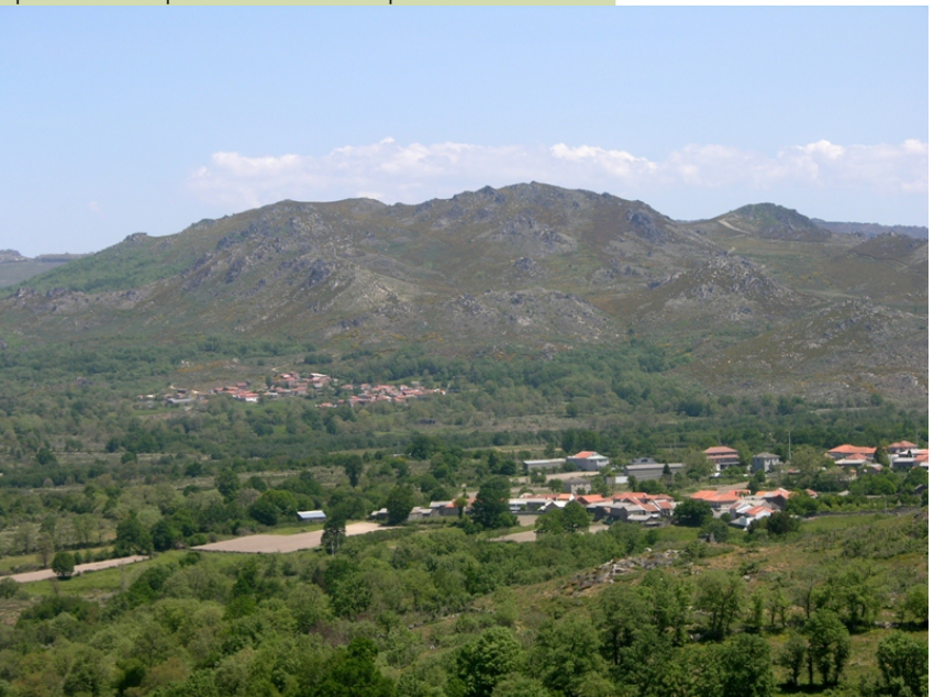
Vista sur dos montes do Cebreiro