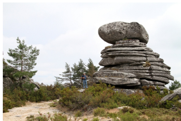
Penedo das Fatigas.