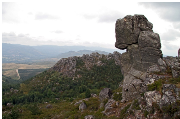
Pena da Ave.