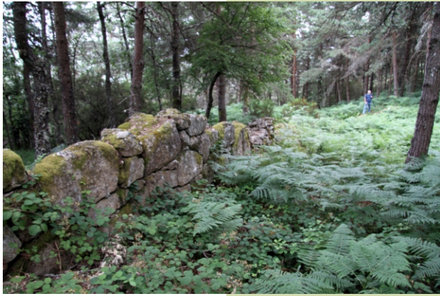
Foxo do lobo do Cebreiro. Unha das paredes medía medio km e a outra case un km.