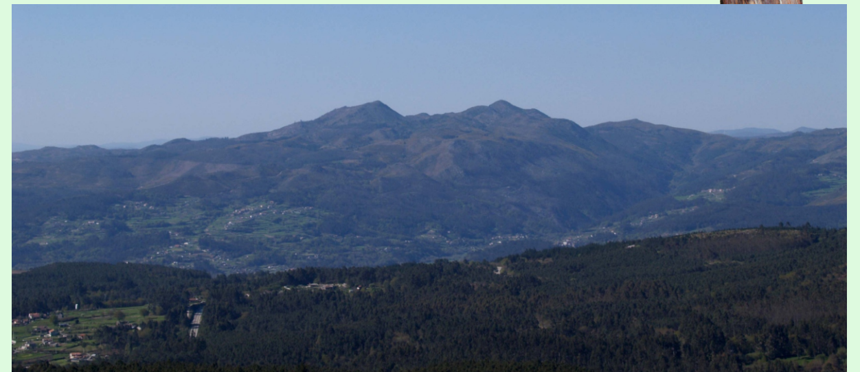
Vista da aba leste do Galleiro desde os montes da Paradanta.