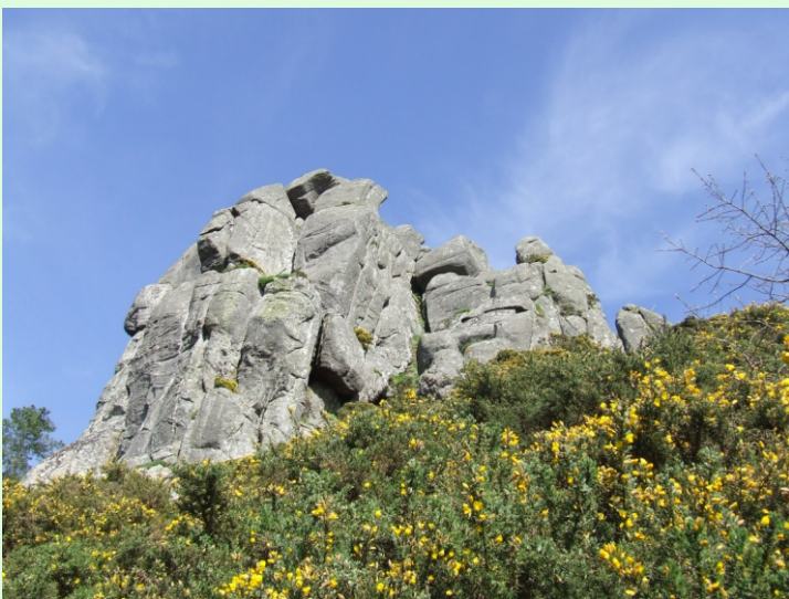
Petón de Xalo, parede granítica onde se practica a escalada.

Accedese desde a N-550 Santiago-A Coruña, en Tabeaiaio.