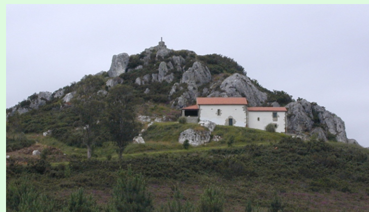
Cume do Pico Sacro e Capela de San Bastián.

Monte de 533 m cun gran interese paisaxístico (vistas sobre unha ampla zona) e xeolóxico. Está constituído por seixos moi puros que sobresaen sobre a paisaxe suave do contorno. Arredor desde monte existen moitas lendas sobre a existencia de dragóns e serpes ou as súas virtudes curativas. Accedese pola N-525, desde Lestedo.