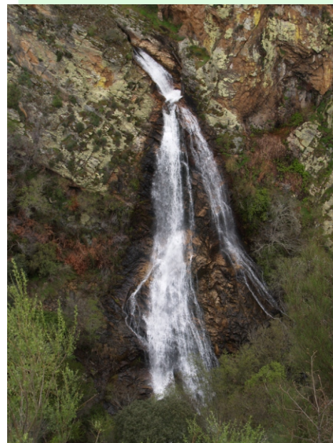
Fervenza da Ola no monte Fraga dos Tocos.