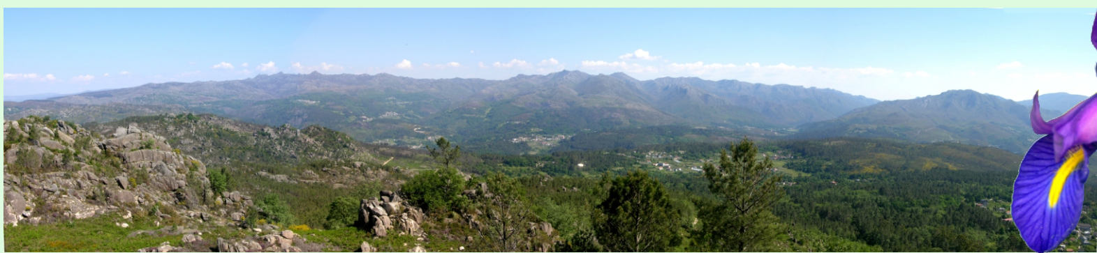
Vista xeral da serra do Xurés desde o mirador de Queguas. Á dereita a serra de Santa Eufemia.