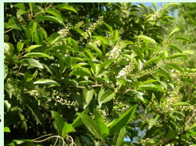
Loro ou acereiro ( Prunus lusitanica ), única localización de Galiza.

Forma parte do Espazo declarado Zona de Especial Protección dos Valores Naturais "Baixa Limia-Serra do Xurés", proposto para a Rede Natura 2000 e do Parque Natural do mesmo nome. Accedese desde Lobios, onde hai un centro de información do Parque Natural.