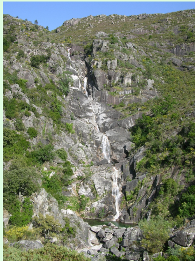
Salto de Corga da Frecha, un afluente do Riocaldo.