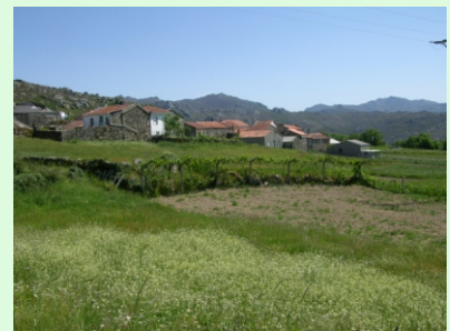
Alvíte, unha das poboacións máis altas do Xurés, ao pé dos Pitoes.