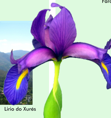
Lirio do Xurés