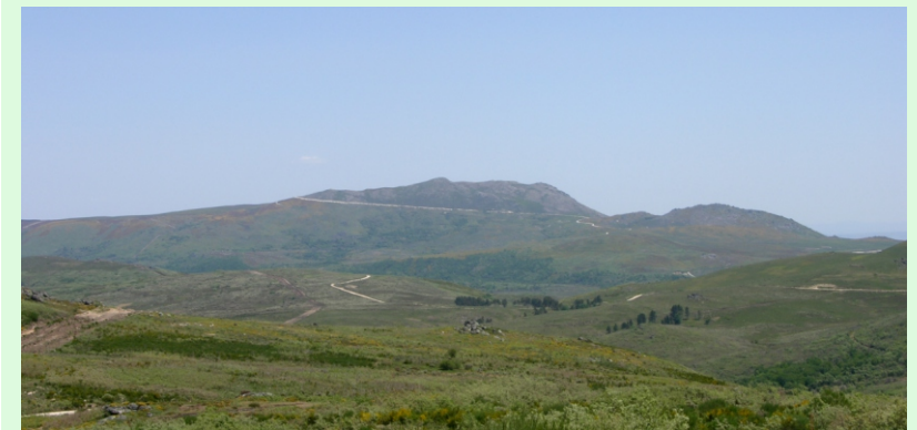
Serra de Larouco, vista oeste, desde Calvos de Randín.