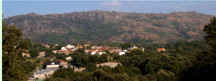
Vilardevós, coas formacións graníticas da serra detrás.