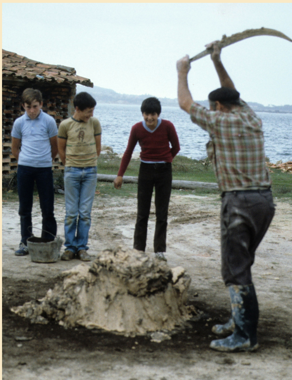
Chaviando co sable para facer a mudada.