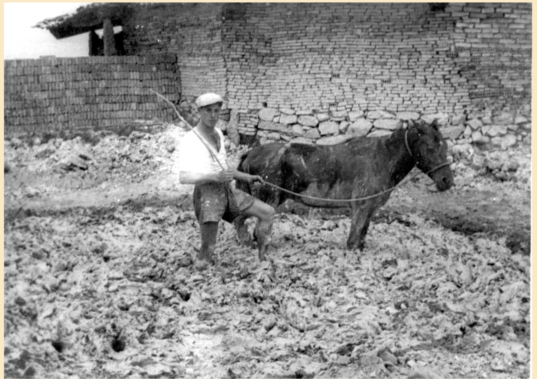
Pieiro nunha telleira de Castelo.

Unha vez amasado o barro o carretilleiro leváboo ao pé da zona de traballo e alí amasábase de novo cun sable ou ferro acoitelándoo ou chaviándoo ata que quedaba ciscado. Logo volvía a amorearse e repetíase o traballo varias veces ata que quedase uniforme e ben ligado. Este proceso coñecía-se co nome de MUDADA.