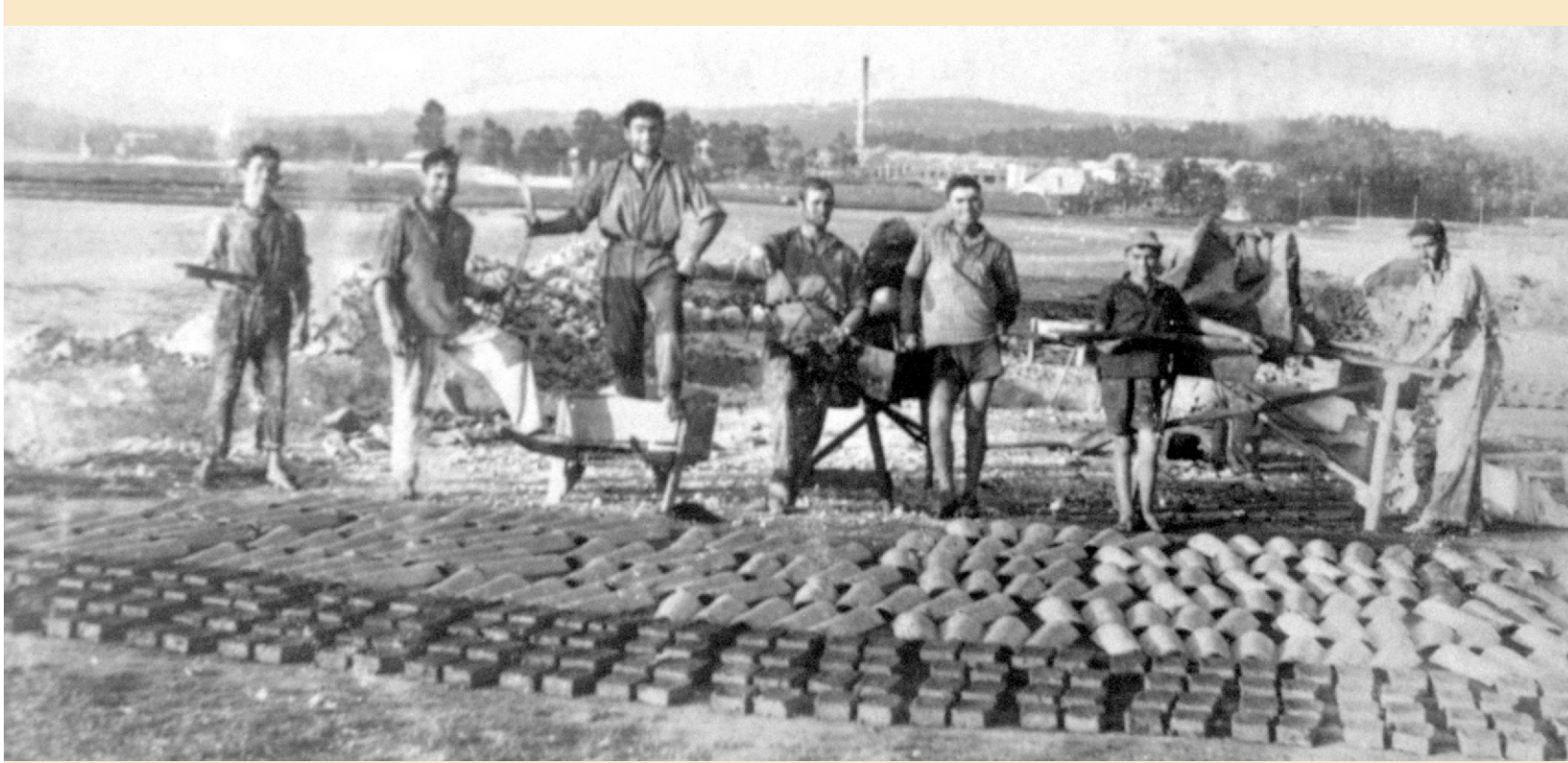
Cuadrilla nunha telleira de Cateira

Os traballadores da telleira estaban organizados nunha CUADRILLA formada por un mínimo de cinco persoas na que cada unha tiña a súa función: