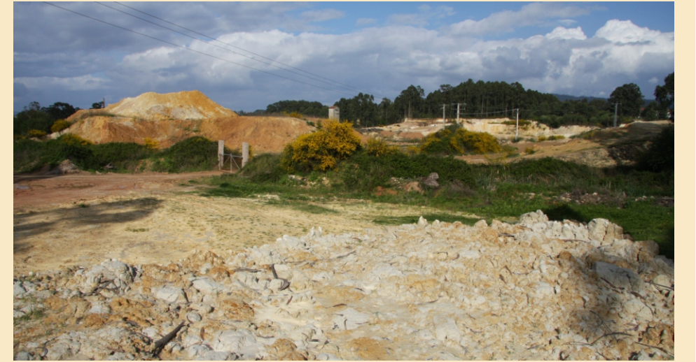
Barreira en Vilalonga.

Na enseada do Umia o barro extraíase ademais do fondo do mar aproveitando as secas. Ás veces traballábase mesmo con auga, rodeando o espazo de traballo cunha caixonada, e facíase o transporte en lanchas.