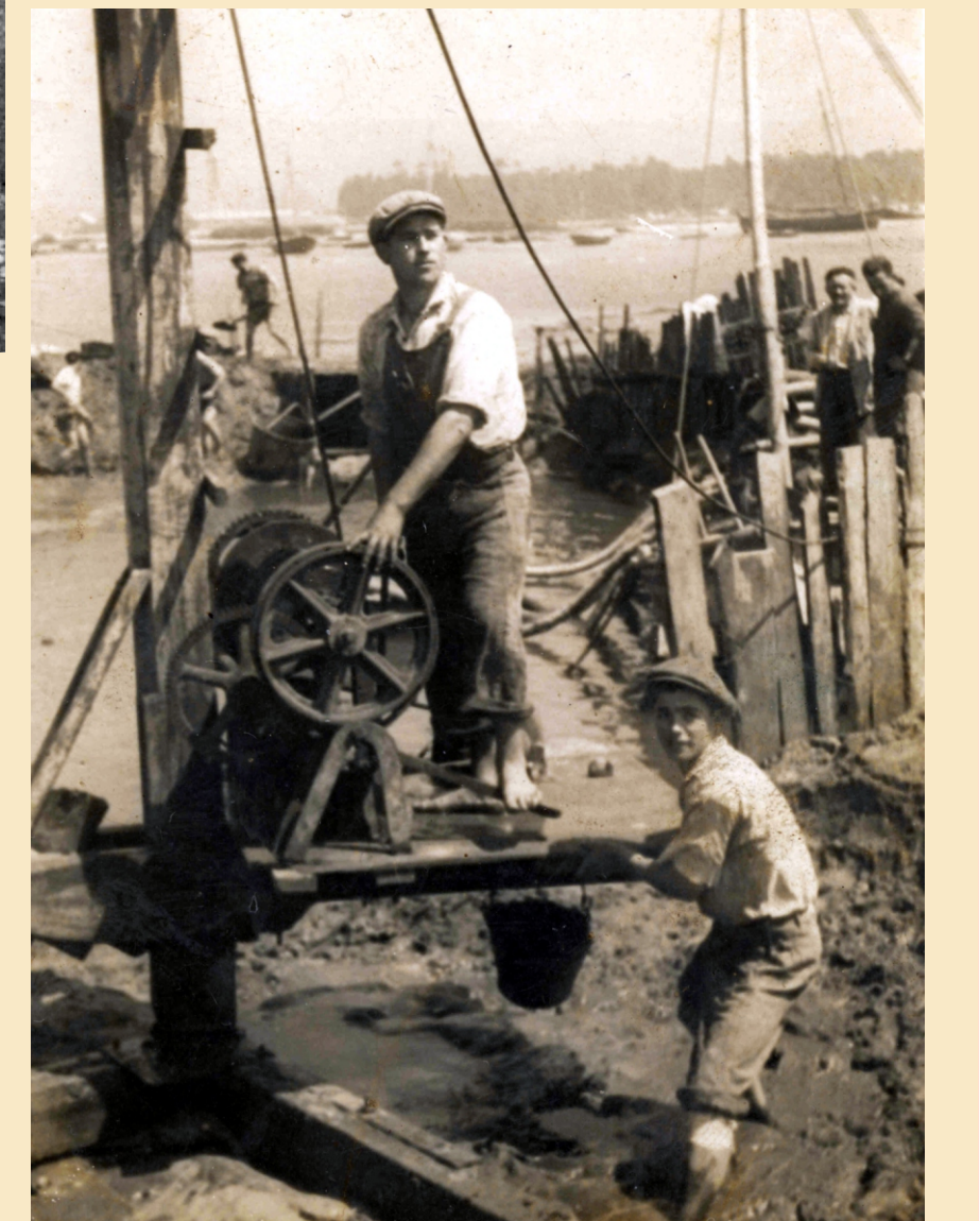
Extracción de barro para as fábricas de Vilalonga. A mediados do século XX comezaronse a usar grás para cargar o barro e bombas para achicar a auga dos pozos.

Nunha seca un equipo de homes podía facer pozos de ata seis m de fondo e sacar de 10 a 15 toneladas de barro.