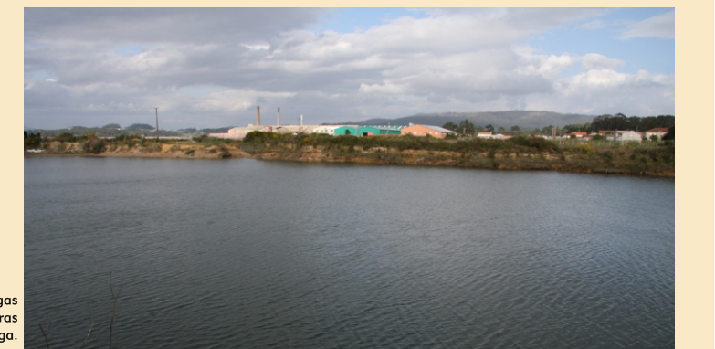
Pozas de antigos barreiros en Vilalonga.