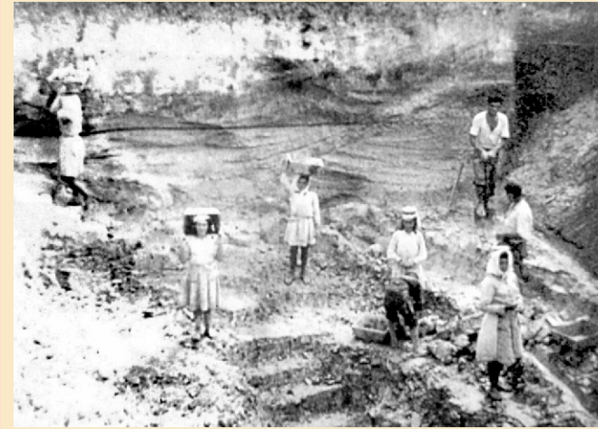
Mulleres carrexando barro nunha barreira de Vilalonga.

Nunha seca un equipo de homes podía facer pozos de ata seis m de fondo e sacar de 10 a 15 toneladas de barro.