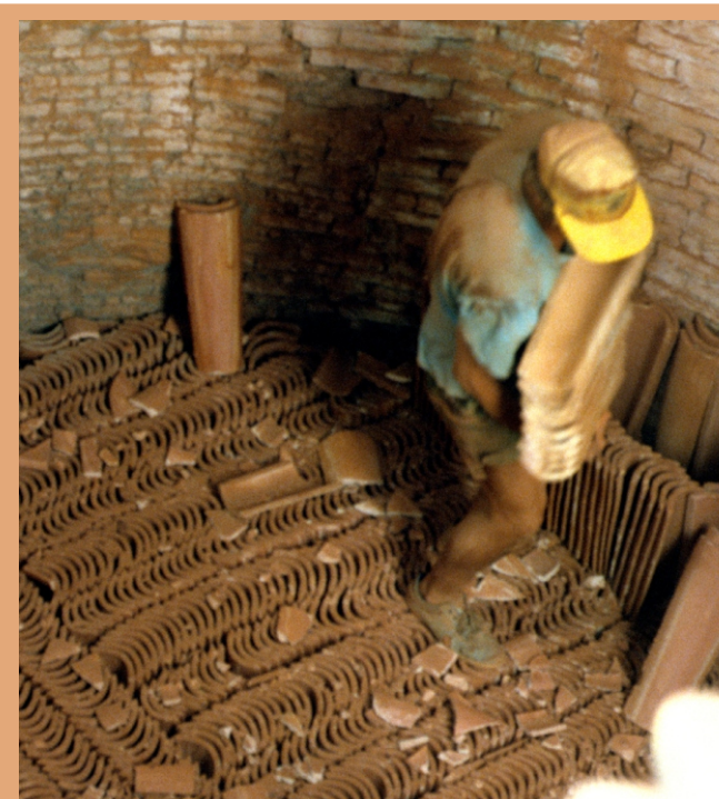
Desencañando unha fornada de tella.